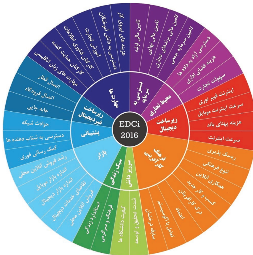
شکل ۱. متغیرهای سنجش ظرفیت شهر دیجیتال برای فعالیت‌های نوپا

شهر الکترونیک و به طور مشابه شهر دیجیتال عبارت از شهری است که در آن اداره امور شهروندان که شامل خدمات و سرویس‌های دولتی و سازمان‌های بخش خصوصی به صورت بر خط (آنلاین) و به صورت شبانه‌روزی است، در هفت روز هفته با کیفیت و ضریب ایمنی بالا انجام می‌گیرد؛ به عبارتی دیگر می‌توان گفت در شهر الکترونیک تمام خدمات مورد نیاز ساکنان از طریق شبکه‌های اطلاع‌رسانی تأمین می‌شود (مرادی‌مفرد و همکاران، ۱۳۹۳، ۷۴-۷۳). اگرچه ارائه تعریفی جامع و مانع برای شهر دیجیتال به سبب ابعاد و خصوصیات متنوع و متغیری که دارد دشوار است اما به نظر می‌رسد نمودار ارائه شده توسط انجمن دیجیتال اروپا، می‌تواند تصویری از متغیرهای شهر دیجیتال را ارائه دهد (شکل ۱).