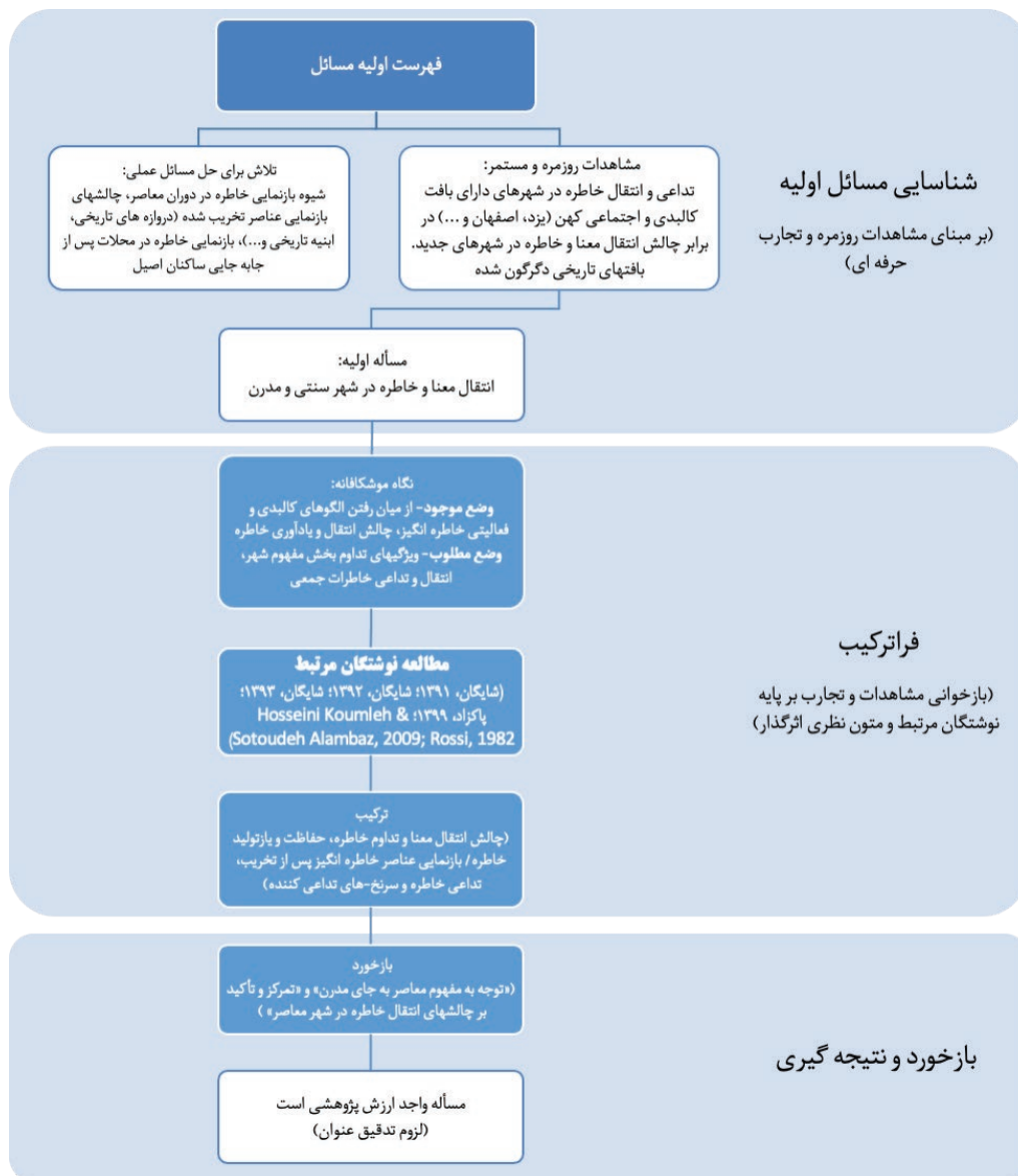
شکل ۳. ارزیابی مسئله شماره یک (انتقال معنا و خاطره در شهر سنتی و مدرن) از حیث ارزش پژوهشی

پس از تهیه فهرست اولیه مسائل مرتبط با خاطره جمعی، ارزیابی این مسائل بر پایه فرآیند چهارمرحله‌ای مبتنی بر فراترکیب و دریافت بازخورد صورت می‌پذیرد. جدول ۲ به صورت عام و اجمالی فرآیند ارزیابی مسائل یازده‌گانه را نشان می‌دهد. در «نگاه موشکافانه»، موضوعات بیانگر شکاف وضع موجود و شرایط مطلوب مورد اشاره قرار گرفته و پس از آن «مطالعه اجمالی» در نوشتگان مرتبط با مفاهیم مربوطه و سپس «تحلیل» ترکیبی و «جستجوی بازخورد» از اساتید راهنما و جامعه علمی و نتیجه‌گیری صورت پذیرفته است. در اینجا بازخورد به صورت مستقیم از اساتید راهنما و هم‌میزان بیرونی (سایر صاحب‌نظران مندرج در پانویس پنجم) دریافت شده است. بر پایه شکل ۲، در این بخش، ارزیابی چهارمرحله‌ای دربرگیرنده فراترکیب مطالعات و متون نظری و دریافت بازخورد از اساتید و خبرگان است. به عبارت دیگر، نگاه موشکافانه به مقایسه وضع موجود و وضع مطلوب و مفاهیم به‌دست‌آمده از آن زمینه‌ساز فراترکیب نوشتگان مرتبط با مسائل اولیه و یا مطالعات بنیادی