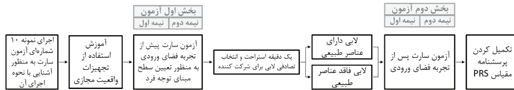
شکل ۳. فرایند اجرای پژوهش

آزادانه به عبور از لابی ساختمان پرداخته و برای رفتن به طبقات بالاتر خود را از درب ورودی به راه پله و یا آسانسور برساند. پس از آن شرکت کنندگان بخش دوم آزمون سارت را انجام داده و پرسشنامه مقیاس PRS را نیز تکمیل نمودند.