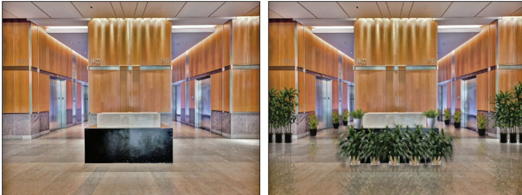
شکل ۲. نمایی از لابی دارای عناصر طبیعی (سمت راست) و لابی فاقد عناصر طبیعی (سمت چپ)

نشان داده که تجربه محیط‌های واقعیت مجازی با کیفیت یادشده که در آن فرد به اختیار خود به حرکت و جست‌وجو در محیط می‌پردازد، می‌تواند تأثیرات جسمی و روانی مشابه تجربه دنیای واقعی را در افراد ایجاد کند (Bailenson, 2018). بدین ترتیب همان‌طور که در شکل (۲) مشاهده می‌شود، دو نمونه سه‌بعدی لابی برج مسکونی در نرم‌افزار Rhinoceros 3D نسخه ۶ ساخته شده و سپس به کمک نرم‌افزار Lumion 3D Rendering تنها به یک نمونه، عناصر طبیعی و جزییات مانند گلدان، درختچه، گل و گیاه اضافه شد. سپس از طریق نرم‌افزار دو خروجی واقعیت مجازی از این دو طراحی گرفته شده و در محیط نرم‌افزار واقعیت مجازی Unity به عنوان محیط پژوهش مورد استفاده قرار گرفتند.