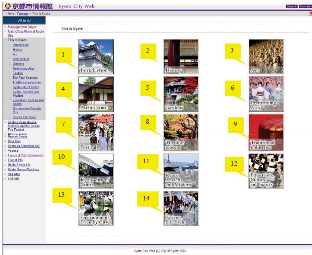
شکل ۴. نمونه‌ای از یکی از صفحات اصلی، تصویر وبسایت رسمی کیوتو اختصاص داده شده برای معرفی محل

همانطور که در شکل بالا مشخص است توجه عمده وبگاه کیوتو بر مسائل فرهنگی در راستای هویت بخشی محلی است که در قالب (۱) معرفی اجمالی محل، (۲) تاریخچه، (۳) هنرهای محلی، (۴) معماری سنتی و مدرن محل، (۵) باغ‌های دیدنی منطقه معرفی شده به عنوان میراث ملی، (۶) هنرهای تجسمی محل (نمایش کابوکی، موسیقی و غیره)، (۷) فستیوال‌ها و جشن‌های محلی، (۸) معرفی جاذبه‌های کیوتو در هر فصل به‌طور جداگانه، (۹) معرفی صنایع خانگی محل و قدمت آنها، (۱۰) معرفی صنایع دستی محل، (۱۱) معرفی مکان‌های دیدنی، ابنیه باستانی و مدرن کیوتو، (۱۲) معرفی قطب‌های فرهنگی، علمی، آموزشی و ورزشی محل، (۱۳) معرفی برنامه‌های اکولوژیکی و محیط زیستی منطقه و (۱۴) معرفی و توضیح سبک زندگی در کیوتو ارائه شده است.