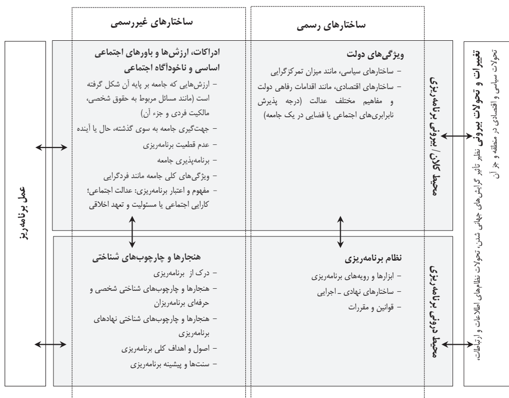
شکل ۲. چارچوب مفهومی پیشنهادی برای تحلیل محیط برنامه‌ریزی و عمل برنامه‌ریزی