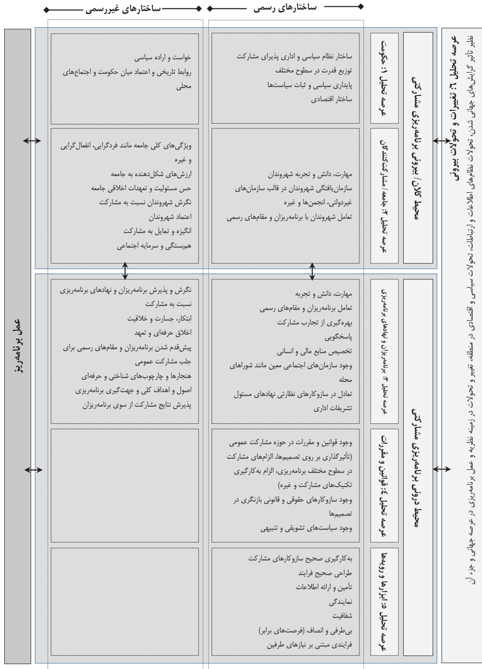
شکل ۴. مدل مفهومی پیشنهادی برای تحلیل عوامل مؤثر بر تحقق مشارکت شهروندان با توجه به مؤلفه‌های محیط برنامه‌ریزی (محیط برنامه‌ریزی مشارکتی)

محیط برنامه‌ریزی، به شش عرصه تحلیل افزایش یافته است. عرصه محیط بیرونی برنامه‌ریزی مشارکتی شامل حکومت و مشارکت‌کنندگان و سه عرصه محیط درونی برنامه‌ریزی مشارکتی شامل برنامه‌ریزان و نهادهای برنامه‌ریزی، قوانین و مقررات و ابزارها و رویه‌ها است. عرصه ششم تحلیل در مدل پیشنهادی دربرگیرنده تغییر و تحولات بیرونی است. این مدل می‌تواند به شناسایی محدودیت‌های محیط برنامه‌ریزی ایران در حوزه مشارکت شهروندان کمک کند. شکل ۴ نشان دهنده مدل مفهومی پیشنهادی این پژوهش است.