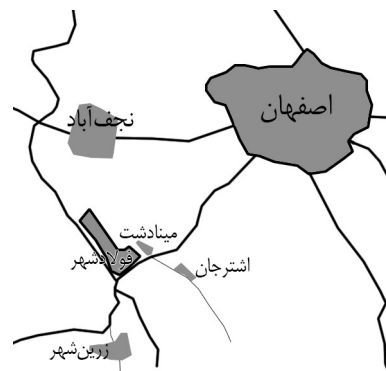
شکل ۱. مکان‌های انتخاب شده به‌عنوان منطقه پیرامونی مکان