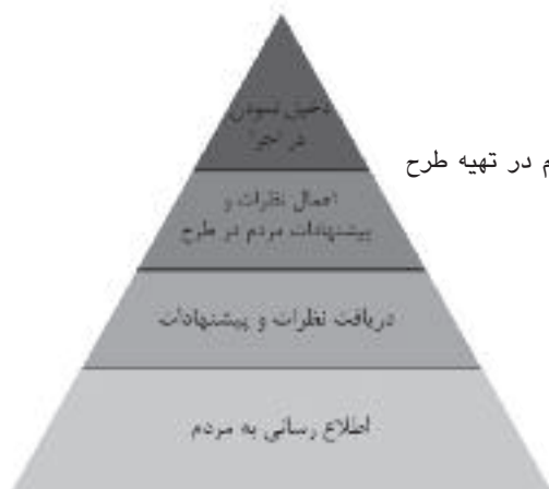
شکل ۵: سطوح مشارکت مردم در تهیه طرح نهایی