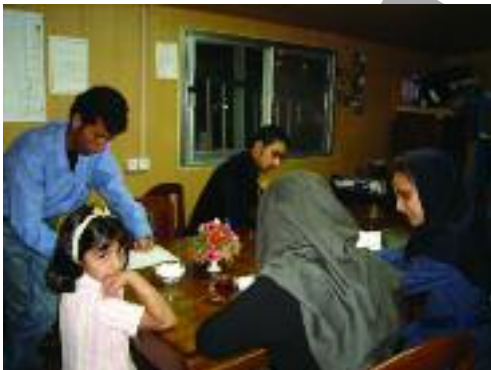
تصویر ۱: همکاری ساکنان محله در تکمیل پرسشنامه‌ها (تاریخ عکس برداری: اردیبهشت ماه ۱۳۸۶)

در پرسشنامه سعی شده است سئوالات مطرح شده در بخش‌های مختلف با ویژگی‌های محل تطبیق و با شاخص‌های کیفیت زندگی تلفیق گردد. به همین دلیل پرسش‌هایی حذف یا اضافه گردیده است. در بخش اول سئوالات کلی درباره محله پرسیده شده به طوری که پاسخ‌دهنده آزادانه بتواند احساس خود را نسبت به محله و به طور خاص محل سکونتش اظهار نماید. در بخش دوم با توجه به شاخص‌های کیفیت زندگی در پنج سئوال به ابعاد مختلف چالش‌های پیش روی محله از