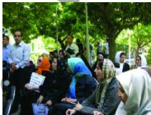
تصویر ۳: تصویری از جلسه عمومی نقد و بررسی طرح (تاریخ عکسبرداری: اردیبهشت ماه ۱۳۸۶)