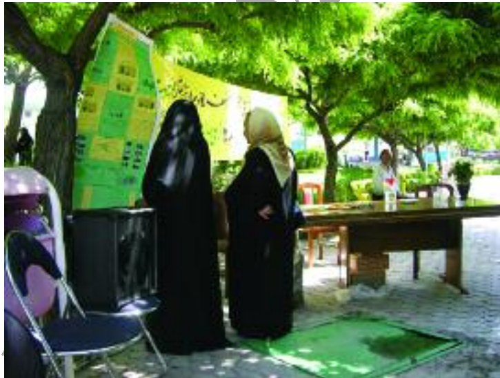
تصویر ۲: تصویری از جلسه عمومی نقد و بررسی طرح (تاریخ عکسبرداری: اردیبهشت ماه ۱۳۸۶)

در ابتدای جلسه، مردم در حضور شهردار منطقه شش مشکلات و نیازهای محله خود را بیان کردند. در ادامه شهردار به همراه اعضای شورای محله و جمعی از ساکنان به بازدید پیاده از محل پرداختند و در انتها، طرح اولیه تهیه شده از طریق پوستر در حضور مردم و شورای محل تشریح گردید و مردم نظرات و سئوالات خود را در زمینه طرح ارائه شده، مطرح نمودند. برای ملموس تر شدن پیشنهادها برای ساکنان تعدادی از پروژهها به صورت اولیه طراحی شد و در جلسه به نمایش درآمد. این امر در دریافت نظرات از مردم کمک شایانی نمود. علاوه بر جلسه برگزار شده پوسترهای تهیه شده به همراه توضیح مختصری از طرحهای اولیه به مدت یک هفته در دفتر شورایی محله به منظور دریافت نظرات مردم به نمایش گذاشته شد.