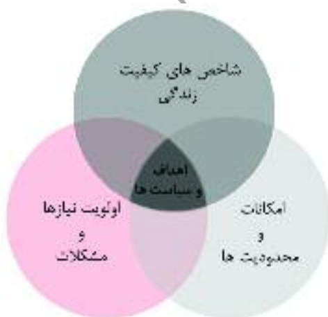
شکل ۴: معیارهای مؤثر در تدوین اهداف طرح (مأخذ: رشیدی‌فر، شرفی، ۱۳۸۶)

تهیه یک طرح بر مبنای مشارکت مردمی تنها به مرحله شناخت و تکنیک‌های محدودی نظیر مصاحبه و تکمیل پرسشنامه خلاصه نمی‌گردد. بلکه مشارکت باید به‌عنوان یک اصل مهم در تمامی مراحل پروژه مد نظر قرار گیرد. یکی از مهم‌ترین این مراحل، تدوین اهداف و سیاست‌های طرح است. بدین منظور اولویت مشکلات و نیازهای ساکنان محله به‌عنوان مهم‌ترین عامل در تدوین اهداف و سیاست‌ها در نظر گرفته شد. عنصر مهم دیگر در تدوین این اهداف، شاخص‌های کیفیت زندگی بود که به تفصیل در بخش قبل به آن‌ها اشاره گردید. در کنار این دو عامل مهم، محدودیت‌ها و امکانات موجود در محل نیز به‌عنوان یک عامل مهم و تأثیرگذار در نظر گرفته شد.