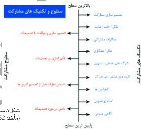
شکل ۱: سطوح و تکنیک‌های مشارکت (مأخذ: Dell'i Prisco, 2003, 62)

یکی از مشهورترین نظریه‌ها در زمینه مشارکت مردمی، نظریه نردبان مشارکت شری ارنشتاین است که در اواخر دهه ۱۹۶۰ میلادی مطرح گردیده است. وی مشارکت مردمی را در هشت درجه یا سطح تعریف نموده است که طیفی از فریب‌کاری تا اختیار کامل شهروندان را دربر می‌گیرد.