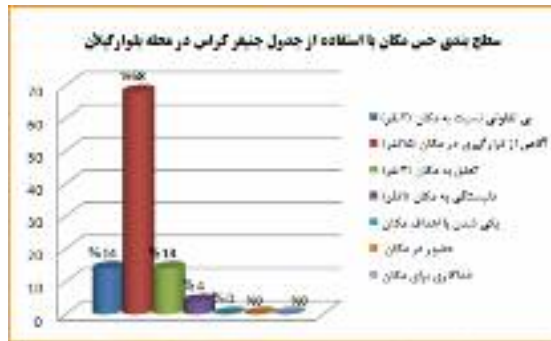
نمودار شماره ۵: امتیازدهی و سطح بندی حس مکان با استفاده از جدول جنیفر کراس در بلوار گیلان