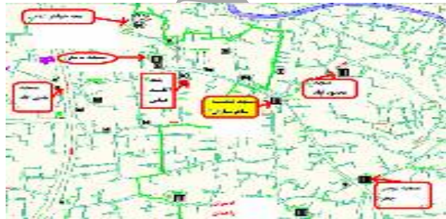
نقشه شماره ۱: موقعیت مراکز مذهبی محدوده محله و اطراف آن