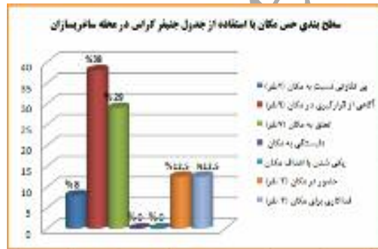
نمودار شماره ۴- امتیازدهی و سطح‌بندی حس مکان با استفاده از جدول جنیفر کراس در محله ساغریسازان

آقای ۷۴ ساله که محل کسب و سکونتش در ساغریسازان است عنوان می‌کند: «علی‌رغم مشکلات مالی که دارم و نیز ترافیک و... به این مکان افتخار می‌کنم. همه مرا می‌شناسند و این قضیه حس خوبی به من می‌دهد». یا آقای دارای مدرک دکترای جغرافیای انسانی ۴۴ ساله که مدت ۲ سال در این محله زندگی کرده می‌گوید: «به نظرم این محله، خیلی با دوراندیشی شکل نگرفته و نیازهای امروز در آن دیده نشده است. البته پارامترهای مثبتی مثل حضور قوی آدمیان در آن موج می‌زند».