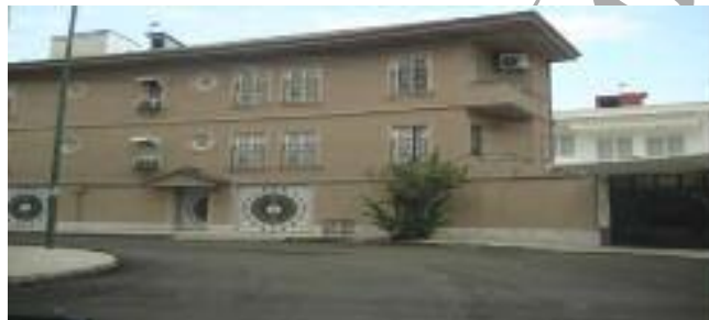
تصویر شماره ۴: نمایی از یک خانه بسیار مدرن و شیک در بلوار گیلان