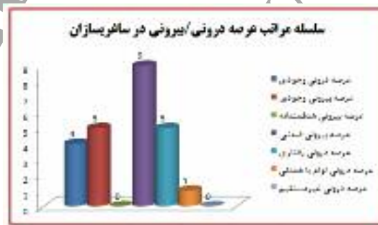
نمودار شماره ۲: نتایج مصاحبه‌ها درخصوص سلسله مراتب عرصه درونی/ بیرونی در ساغریسازان بر حسب مراتب هفت‌گانه رلف (مأخذ: نگارندگان)