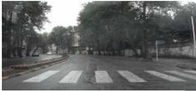
تصویر شماره ۳: به کارگیری قوس در خیابان اصلی بلوار گیلان