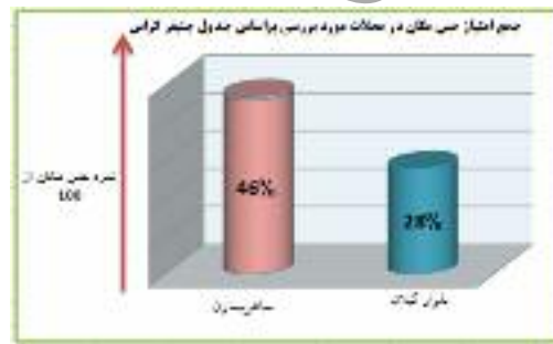
نمودار شماره ۶: مقایسه جمع بندی امتیازات حس مکان در محلات مورد بررسی بر اساس جدول جنیفر کراس

در واقع، مجموع امتیازات مصاحبه‌شوندگان در هر مرحله به دست آمده و بر تعداد حداکثر امتیازهای ممکن تقسیم شده است (هر فردی می‌تواند در بالاترین سطح حس مکان، دارای امتیاز هفت باشد).