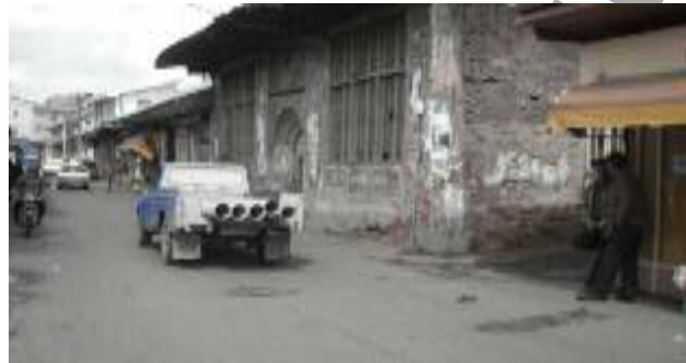
تصویر شماره ۲: خیابان اصلی ساغریسازان که از بازار نیز گذر می‌کند.

قدمت و سنت از ویژگی‌های مهم و قابل توجه محله ساغریسازان است که در آن، فقیر و غنی در کنار هم بدون جدایی‌گزینی زندگی می‌کرده‌اند و امروزه بافتی فرسوده و تاریخی محسوب می‌شود که بخشی از آن دستخوش تغییر شده و بسیاری از ثروتمندان محله از آن کوچ کرده‌اند (شرکت مهندسی طرح و کاوش، ۱۳۸۶، ۳۴). عناصر مهم محله شامل مسجد گلدسته ساغریسازان، بقعه آقاسیدعباس و اسماعیل، حمام حاجی و تعدادی خانه‌های قدیمی با ارزش است.