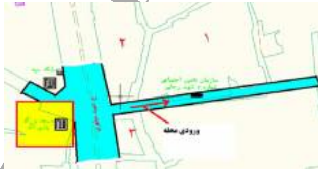
نقشه شماره ۵: ورودی ساغریسازان از سمت چهارراه بادی‌الله (مأخذ: نگارندگان)

گشودگی و یا ورودی اصلی محله، بدون شک چهارراه بادی‌الله در تقاطع خیابان مطهری است که اگر از آن سمت وارد محله شویم کاملاً حس ورود به درون محله به انسان القا می‌شود.