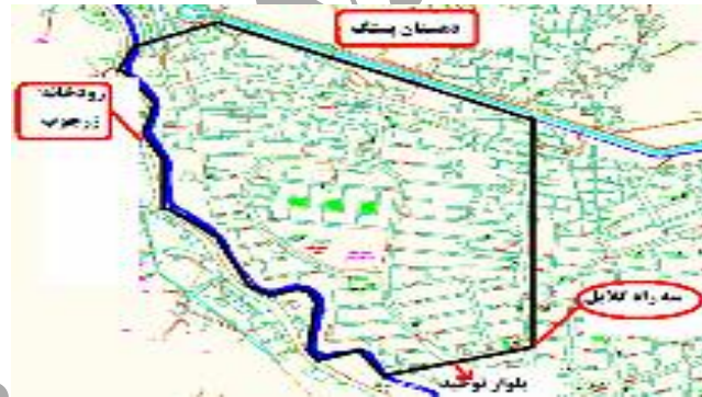
نقشه شماره ۳: مرز و قلمرو در محله بلوار گیلان

با توجه به مصاحبه‌های انجام شده، از دیدگاه مصاحبه‌شوندگان، محله بلوار گیلان دارای مرزهای دقیق و معینی است و این موضوع به دلیل وجود جواب‌های مشابه پاسخ‌دهندگان در مورد مرزهای محله است؛ به طوری که در شمال محله، سه راه گلابیل نقش مرزی و ورودی اصلی را ایفا می‌کند. در سمت غرب بلوار گیلان، کانال آبی موجود است که در واقع محل جداسازی آن از دهستان پستک بافت کاملاً روستایی است. در سمت شرق بلوار گیلان، بلوار توحید به عنوان یک لبه، مرز محله را شکل می‌دهد. محدوده بلوار گیلان در جنوب، به رودخانه زرجوب می‌رسد که به صورت تقریباً خطی و به شکل یک لبه به انتهای خیابان‌های جنوبی بلوار منتهی می‌گردد. وجود نشانه‌های خطی و گرهی، به ساکنان و دیگر افراد کمک می‌کند تا راحت‌تر مرزهای محله را تشخیص دهند.