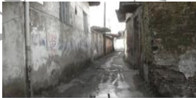
تصویر شماره ۱: یکی از کوچه‌های محله ساغریسازان

ساغریسازان بخشی از محله بزرگ زاهدان است و از جمله محلات قدیمی شهر رشت محسوب می‌شود. این محله و بناهای یاد شده آن بیش از یک و نیم قرن قدمت دارد و بخشی از آن جزء بافت فرسوده به حساب می‌آید. این محله به تدریج و بدون برنامه قبلی، به تبعیت از بازار قدیمی رشت در زمان صفویه و در اطراف بازار، به مرور توسط ساکنان آن ساخته شده و مورد استفاده مسکونی قرار گرفته است. این محله از یک راسته بازار تشکیل می‌شود (وب سایت شورای شهر رشت، ۱۳۸۸). ساغریسازان جزء محدود محلات رشت است که بافت سنتی خود را تا حد زیادی حفظ کرده است. از جمله مشخصه‌های دیگر محله، وجود چندین مرکز مذهبی در آن است.