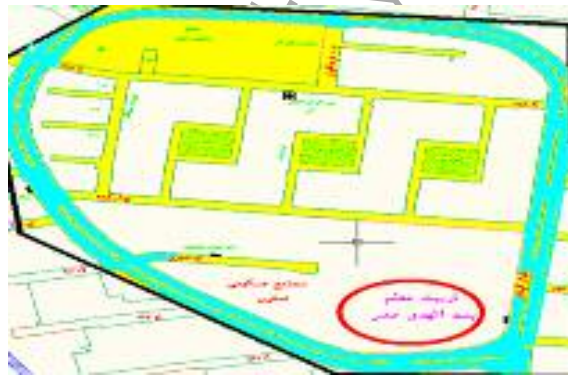
نقشه شماره ۴: محصوریت در بلوار گیلان

می‌توان گفت کل محله بلوار گیلان حالت میدان بزرگی را دارد که به مرکزیت محدوده مرکز تربیت معلم شکلی حلقوی به کل بلوار می‌دهد. یعنی کل محله شکلی متمرکز و نیز محصور دارد. در ضمن در گروه‌های مختلف سنی و جنسی، پاسخ‌های متفاوتی به پاتوق‌های محله داده شد.