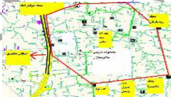
نقشه شماره ۲: محدوده محله ساغریسازان و محلات اطراف

هر نوع محصوریتی به وسیله مرز تعریف می‌شود. هایدگر در این باره می‌گوید: «مرز آن نیست که بعضی چیزها در آن متوقف می‌شوند، بلکه همان‌گونه که یونانی‌ها نیز پی برده بودند، مرز آن است که از آن بعضی چیزها، شروع به حضور می‌کنند.» (پرتوی، ۱۳۸۷، ۱-۱۰۰). مکان و قلمروی آن، بدون مرزها و ارتباطاتش با محیط مجاور نمی‌تواند موجودیت داشته باشد (سون-یانگ، ۲۰۰۳، ۶۲). جدول نتایج ذیل از این پرسش که «مرز و قلمروی محله، از نظر شما کجاست»، حاصل شده است و چون نوع مصاحبه به صورت پرسش باز بوده است، اکثر مصاحبه‌شوندگان به بیش از یک پاسخ اشاره داشته‌اند. پاسخ‌های پراکنده و گوناگون مصاحبه‌شوندگان نشان داد که تفکیک مرز ساغریسازان برای افراد گوناگون مشکل است. البته این موضوع، به مدت سکونت و استفاده از محیط نیز مرتبط است و ساکنان قدیمی محله در معرفی مرز محله راحت‌تر بودند.