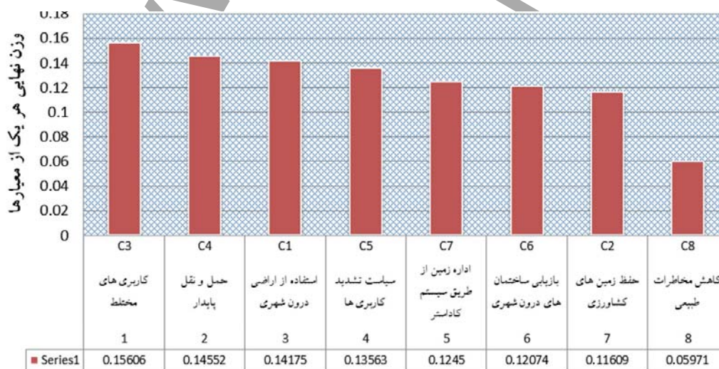
شکل ۴. وزن و رتبه نهایی هر معیار

همان‌گونه که در شکل ۴ شماره مشاهده می‌گردد، نتایج ارزیابی نهایی بیانگر این است که معیارهای کاربری‌های مختلط (C3) و حمل‌ونقل پایدار (C4)، به رغم آنکه بالاترین وزن را به لحاظ اهمیت و روابط متقابل درونی دارند، در سیاست‌ها و راهبردهای طرح جامع تهران توجه کمتری به آنها شده است. این در حالی است که معیارهای حفظ زمین‌های کشاورزی (C2) و کاهش مخاطره‌های محیطی (C8) با وجود وزن و میزان تأثیرگذاری کمتر بر دیگر معیارها، در طرح به آنها بیشتر توجه شده است و به همین دلیل هم در نتیجه نهایی وزن کمتری گرفته‌اند.