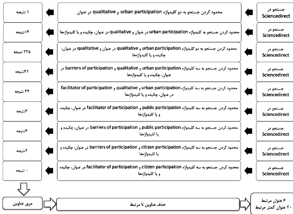
شکل ۱. نمونه فرایند انتخاب مقاله‌ها از پایگاه‌های داده منتخب پژوهش در science direct

در نهایت با مرور مقاله‌های به دست آمده از پایگاه‌های داخلی و خارجی ۱۴۸ مقاله انتخاب شدند و بعد از مرور تمامی مقاله‌ها، ۵۰ مقاله کمتر مرتبط کنار گذاشته شده و ۹۶ مقاله باقیمانده برای استخراج کدها مورد استفاده قرار گرفتند. برای بررسی تأییدپذیری، از کدگذاری توافقی ۲۳ استفاده شد و تمامی اعضای پژوهش در مورد همه کدها به توافق رسیدند، برای اطمینان از اعتبار پژوهش نیز یافته‌های پژوهش، توسط گروهی متشکل از ۶ تن از اساتید و دانش‌آموختگان ۲۴ حوزه برنامه‌ریزی شهری مورد بررسی قرار گرفت و نتایج تأیید گردید.