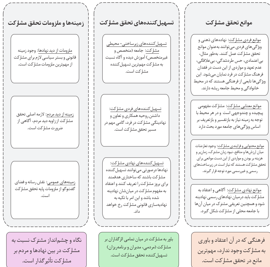
شکل ۳. مفهوم‌سازی موانع و تسهیل‌کننده‌های تحقق مشارکت

(و حتی پیش‌تر از آن در بستر خانواده) آمادگی لازم برای فعالیت‌های مشارکتی را کسب کنند. همچنین باید در نظر داشت که بستر کالبدی جامعه نیز برای گروه‌های خاص (مانند معلولان) مهیا باشد تا در صورت لزوم حضور فیزیکی برای مشارکت مانعی وجود نداشته باشد (Erfani & Roe, 2020; Gwaleba & Chigbu, 2020; Palar et al., 2019; Koch & Christ, 2018; Jomehpour & Behzad, 2020; Barclay & Klotz, 2019; Li et al., 2019; Rahmawati et al., 2014; Elbakidze et al., 2015; Caman et al., 2014; Ampatzidou et al., 2018; Stauskis, 2014; Harris & Roberts, 2003; Wong et al., 2020; Dnes et al., 2021). باید تمامی زیرساخت‌ها اعم از کالبدی و غیرکالبدی، مهیای تحقق مشارکت باشد. چه بسا بسیاری از گروه‌ها با وجود داشتن دغدغه‌های مشارکتی به دلیل نبود بستر مناسب، از فعالیت‌های مشارکتی جا بمانند و در جامعه نادیده انگاشته شوند. در نهایت لازم به ذکر است که مشارکت از آن دسته مفاهیمی است که ارتباط شدیدی با ویژگی‌های فرهنگی جامعه دارد؛ چراکه زمانی که سخن از مشارکت به میان می‌آید نوع کاربرد آن برای هر گروه و دسته‌ای متفاوت است و هر فرد براساس برداشت خود از مشارکت، توقعاتی را در ذهن خواهد داشت که به علت هماهنگ نبودن با سایر گروه‌ها تعارضاتی را در پی خواهد داشت. لازم به تأکید است که تحقق مشارکت در گروهی ایجاد بستری فرهنگی است. به منظور مشخص ساختن نگرش این پژوهش و با توجه به این امر که اساسی‌ترین فرایند علم، مفهوم‌سازی است (Sequeira, 2014)، با توجه به ابعاد و مقوله‌های شناسایی شده و مفاهیم مهم و پایه‌ای هریک از مقوله‌ها که از بررسی عمیق ۹۶ مقاله منتخب، به دست آمد، مدل مفهوم‌سازی پژوهش به شرح زیر است: