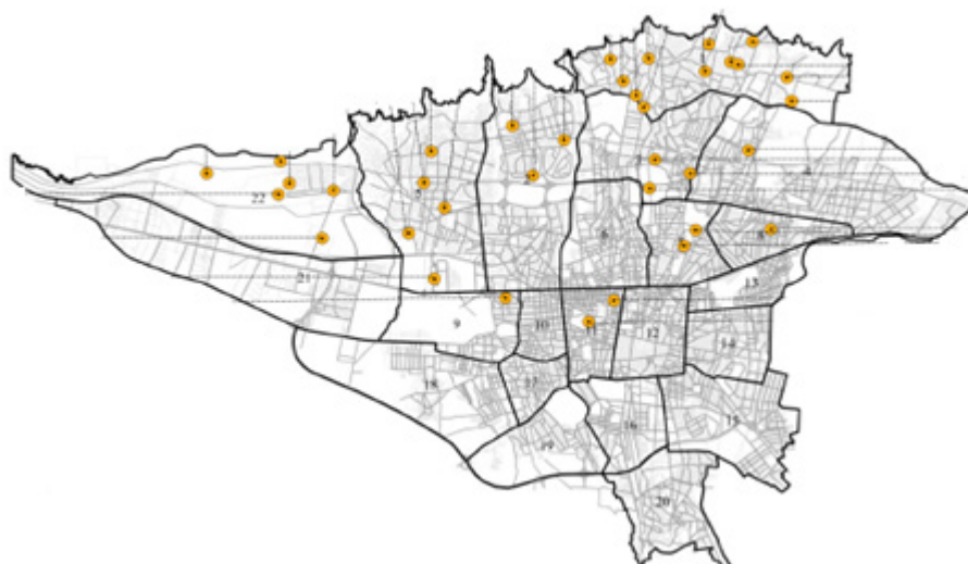
شکل ۱. توزیع مگامال‌ها در شهر تهران