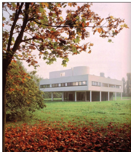
شکل ۹. ویلا ساوا در فرانسه