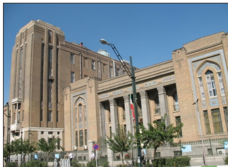
شکل ۱۰. نمای جنوبی کمپانی نفت ایران و انگلیس، برج آرت دکو