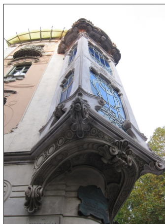
شکل ۴. نمونه معماری آرت نووو (شیوه تزئینات گیاهی)، تورین - ایتالیا

نمادهای بارز این سبک را می‌توان عدم رجعت به تاریخ و گذشته، استفاده از مصالح و فناوری مدرن، استفاده از خطوط مستقیم و استریملاین، استفاده از تزئینات نوظهور و صنعتی، به‌کارگیری پلان‌ها و نماهای متقارن و غیرمتقارن و بالای برج‌ها به صورت پلکانی بیان نمود. در کنار سبک آرت دکو، به‌صورت روز افزونی بر اهمیت و اعتبار سبک دیگری به نام «سبک بین‌الملل» افزوده شد. در سال ۱۹۳۲ م. (۱۳۱۱ ه.ش.) نمایشگاهی در موزه هنرهای مدرن در شهر نیویورک به نام سبک بین‌الملل توسط هنری راسل هیچکاک ۲۰ و فیلیپ جانسون ۲۱ برگزار شد. از جمله ساختمان‌های مهمی که در این نمایشگاه به عنوان نمادهای سبک بین‌الملل عرضه شد می‌توان از مدرسه باهاوس در آلمان (۱۹۲۶ م.) توسط والتر گروپیوس ۲۲ ، پاریس آلان در اسپانیا (۱۹۲۹ م.) توسط میس ون درروهه ۲۳ ، خانه لاول در آمریکا (۱۹۲۹ م.) توسط ریچارد نوتر ۲۴ و ویلای ساووی در فرانسه ۱۹۳۰ م. توسط لوکوربوزیه ۲۵ نام برد. پس از پایان نمایشگاه، کتابی به همین نام (سبک بین‌الملل) توسط هیچکاک و جانسون منتشر و اصول و مشخصات این سبک در آن تدوین شد (Hitchcock, 1997).