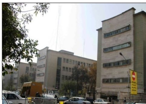
شکل ۱۵. نمای مدرن چهار بلوک شرقی کاخ وزارت دارایی

پلان ساختمان، غیرمقارن و از تداخل یک سری اشکال مربع مستطیل و نیم‌دایره شکل گرفته است. نماها نیز غیرمقارن و با ترکیب خطوط مستقیم و منحنی طرح شده‌اند. بام ساختمان مسطح و نمای ساختمان سیمانی است و همانند دیگر کارهای وارطان به این سبک، دارای تقسیم‌بندی‌های مستطیل‌شکل است. ترکیب پرگولای چوبی با بدنه سیمانی به آن ویژگی خاصی بخشیده است. سازه بنا دیوار باربر است. ساختمان دارای نرده‌های فلزی استریم لاین و یا موج‌دار و زیگزاک‌شکل است که از نمادهای بارز سبک آرت دکو است. تنها رجعت تاریخی در این ساختمان، مجسمه‌های آن است که با اقتباس از مجسمه‌های مصر و یونان باستان طراحی شده‌اند. احتمالاً نصب این مجسمه‌ها بدین لحاظ بوده که فوزیه مصری‌تبار و خواهر ملک فاروق، پادشاه مصر بود. در سایر موارد، هیچگونه نماد و یا تزئینات تاریخی در بنا ملاحظه نمی‌شود. بی‌تردید یکی از منحصر به فردترین ساختمان‌ها به سبک آرت دکو در این دوره که غالب خصوصیات این سبک در آن به صورت هنرمندانه‌ای طراحی شده، کاخ سعدآباد است.