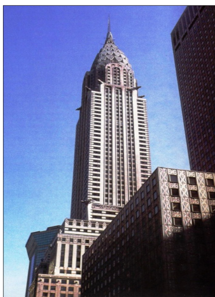
شکل ۲. برج کرایسلر در نیویورک