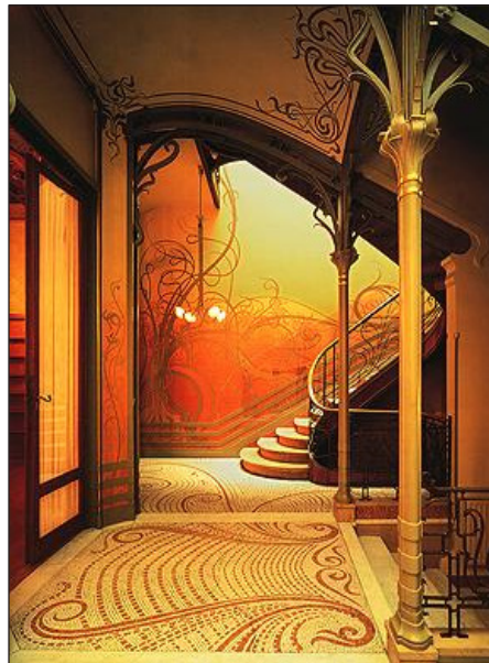
شکل ۱. تزئینات در معماری آرت نووو، اثر ویکتور هورتا

شاعرانه شد. بدین ترتیب به جای اینکه شکاف بین اندیشه و احساس را برطرف سازد، راه افراط در پیش گرفت و به همین دلیل پس از معدود سال‌های حیاتش پژمرده شد. معماری جدید باید برای مدرن شدن، تعبیر ساده‌تری از خاستگاه‌هایش به دست می‌داد.» (نوربرگ شولتز، ۱۳۸۶، ۵۶). این جاست که معماری مدرن، در ورای نگرش‌های آرت نووو، پا به عرصه معماری مدرن عالییه با سبکی به نام آرت دکو می‌گذارد. در ساختمان‌های کوتاه‌مرتبه این سبک، تأکید بر خطوط افقی ممتد (استریم لاین) ۱۲ و در مواردی احداث یک برج مرتفع در میان ساختمان بود. بالای برج غالباً به شکل پله‌ای طراحی می‌شد. تزئینات جذاب با استفاده از خطوط انحنا دار و نرم و یا خطوط زیگزاگ‌مانند و به‌کارگیری رنگ‌های روشن و اولیه و لامپ‌های نئون جزء ویژگی‌های این سبک محسوب می‌شود. در پیش و ابتدای دوره معماری مدرن عالییه (۱۹۱۸-۱۹۳۹ م. ۱۲۹۷-۱۳۱۸ ه.ش.) سبک آرت دکو و سبک بین‌الملل از جمله سبک‌های مهم بودند. آرت دکو نام خود را از «نمایشگاه بین‌المللی هنر تزئینات و صنعت مدرن» ۱۳ که در سال ۱۹۲۵ م. (۱۳۰۴ ه.ش.) در پاریس برگزار شد، به عاریت گرفت. آرت دکو از یک جریان منحصراً فرانسوی به سرعت به صورت یک مد بین‌المللی در طراحی، تزئینات داخلی و معماری در آمد. این سبک به صورت یک نمایش جدید با نمادهایی مصنوعی بود که بین سنت‌گرایی و آینده‌نگری قرار داشت و می‌توان گفت که تحت تأثیر کوبیسم، فوتوریسم، اکسپرسیونیسم و دیگر نهضت‌ها بود (Lampugnani, 1997, 17). هدف نمایشگاه مذکور آشتی دادن هنر و صنعت و به‌کارگیری آنها در کنار یکدیگر به صورت زیبا و هنرمندانه بود. این موضوع در سبک آرت دکو نمودی بارز و غالب دارد.