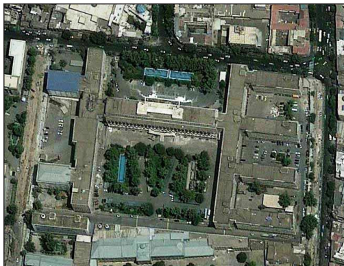
شکل ۱۲. سایت پلان کاخ وزارت دارایی، خیابان باب همایون