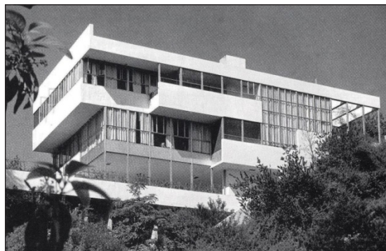
شکل ۸. خانه لاول در کالیفرنیا

خصوصیات شاخص سبک بین‌الملل را می‌توان عدم رجعت به تاریخ و گذشته، عدم استفاده از تزئینات، استفاده از هندسه اقلیدسی، استفاده از مصالح و فناوری مدرن، به‌کارگیری پلان‌ها و نماهای متقارن و نیز غیرمتقارن و همچنین وجود بام مسطح در کالبد آن بیان نمود.