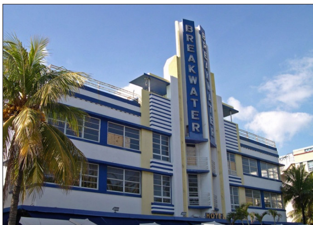
شکل ۵. هتل بیلک واتر در میامی آمریکا 2012/7/8