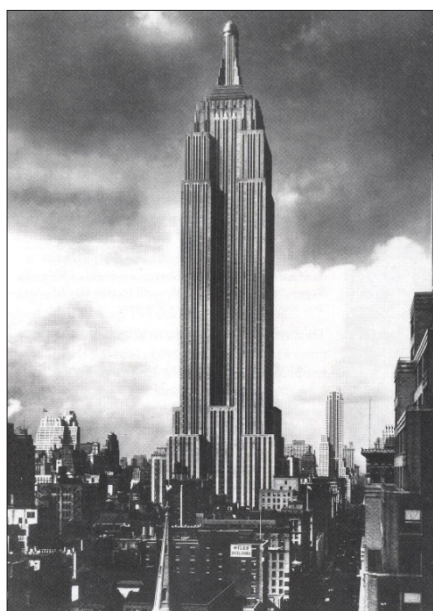
شکل ۳. برج امپایر استیت در نیویورک

سبک آرت دکو برای احداث ساختمان‌های بلندمرتبه نیز مورد توجه بود. در ساختمان‌های بلندمرتبه، تأکید بر خطوط عمودی بوده است. مرتفع‌ترین آسمانخراش‌های آمریکا (و به عبارتی دنیا) در دوران رکود بزرگ اقتصادی (۱۹۲۹-۱۹۳۹ م.) به این سبک ساخته شدند. ساختمان کرایسلر ۱۴ (۱۹۲۷-۱۹۳۰ م.) در نیویورک توسط ویلیام ون آلن ۱۵ طراحی شد و شاخص‌ترین ساختمان این سبک محسوب می‌شود. این ساختمان با ۳۱۹ متر ارتفاع، بلندترین ساختمان در جهان تا قبل از احداث برج مرتفع دیگری به همین سبک به نام امپایر استیت ۱۶ (۱۹۳۴ م.) در نیویورک بود. این برج به ارتفاع ۳۸۱ متر، تا زمان افتتاح برج شمالی ساختمان دوقلوی مرکز تجارت جهانی ۱۷ در نیویورک در سال ۱۹۷۳ م. (به مدت ۴۲ سال) بلندترین ساختمان جهان بود. به هر حال، آنچه ساختمان کرایسلر را با نگرشی سبکی متمایز می‌سازد (هنر تزئینی، آرت نووو و یا شاید اکسپرسیونیستی)، این است که قالب‌های آن از ظریف‌ترین شکل‌ها در زمینه طراحی آسمانخراش تا آن تاریخ بوده است (کرتیس، ۱۳۸۲، ۲۳۷). برج مرتفع مرکز راکفلر ۱۸ (۱۹۳۱-۱۹۴۰ م.) و تالار موسیقی رادیوسیتی ۱۹ (۱۹۳۲ م.) هر دو در نیویورک، جزء بهترین نمونه ساختمان‌های ساخته شده به این سبک است. قسمت فوقانی هر سه برج معروف به صورت پلکانی طراحی شده است. سبک آرت دکو در نقاشی، گرافیک، مجسمه‌سازی و نیز تزئینات پیروان بسیاری داشت.