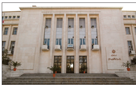
شکل ۱۴. نمای شمالی عمارت مرکزی کاخ وزارت دارایی