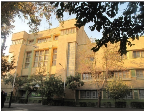
شکل ۱۳. نمای جنوبی ساختمان هنرستان دختران